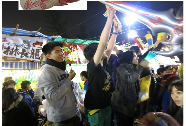
在維園的真道年宵攤位「排長龍」