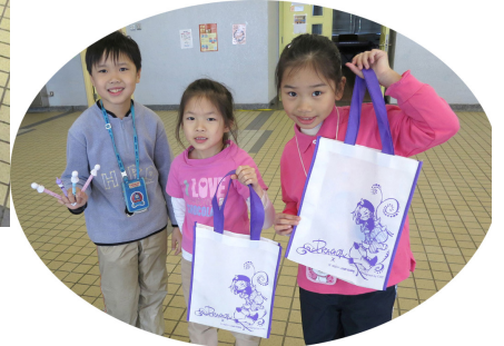
年宵攤位在第一校舍預售