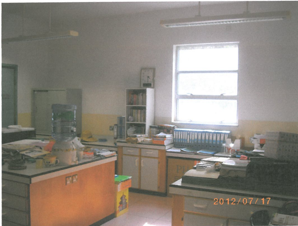
須要施工之舊 翼校舍課室 315室