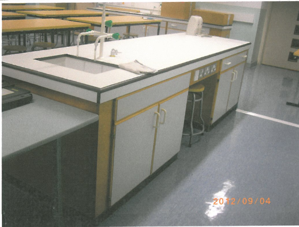
(作參考用途) 舊翼校舍課室 615 課室 - 老師枱