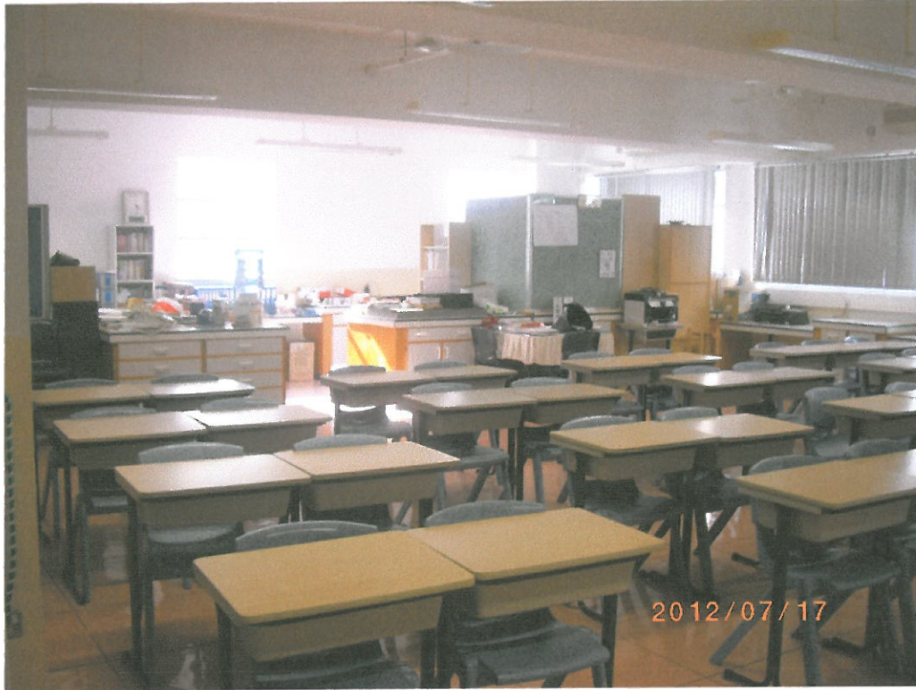
須要施工之舊 翼校舍課室 315室