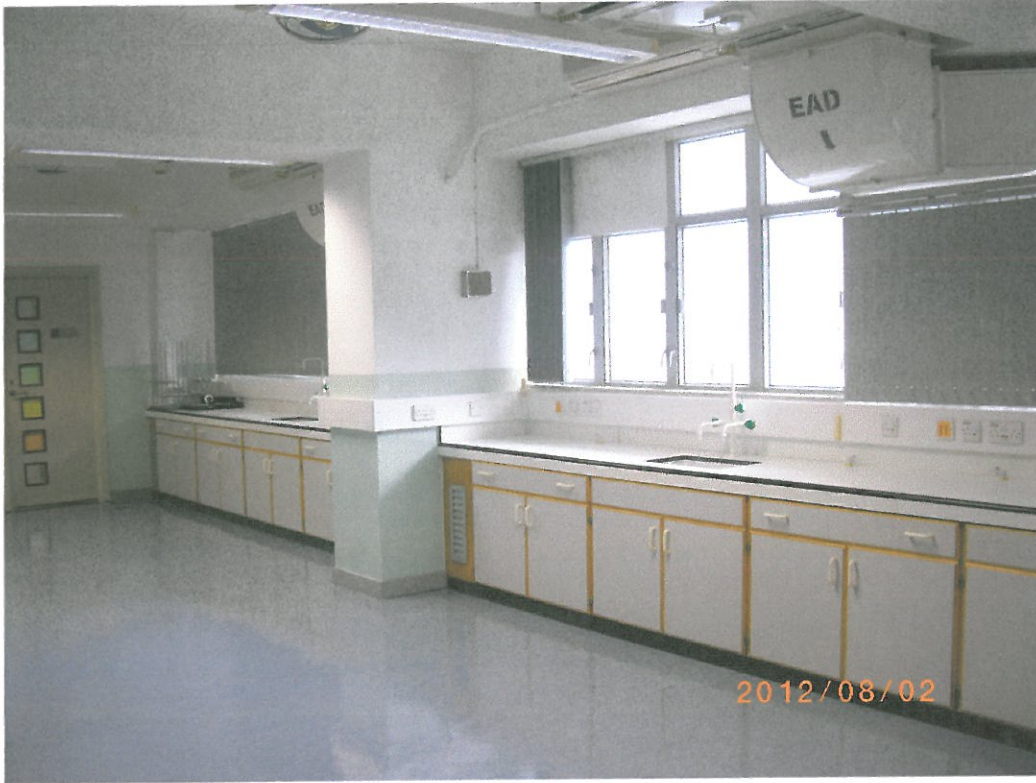
(作參考用途) 舊翼校舍課室 615 課室 - 鋅 盆矮櫃