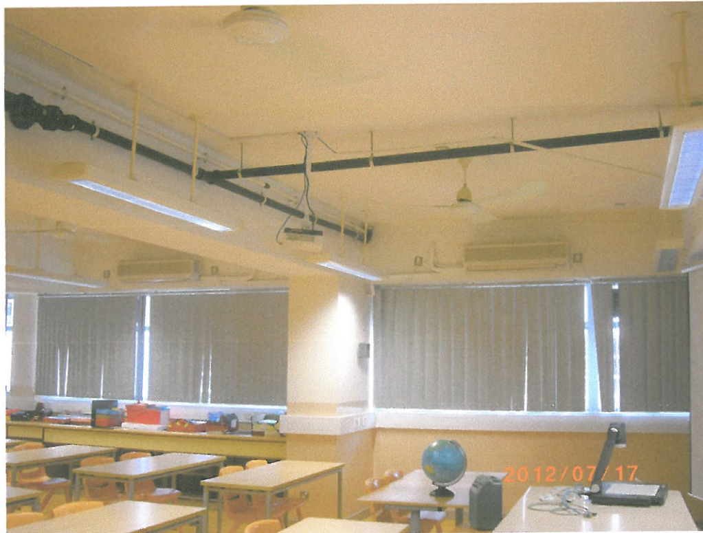
須要施工之舊 翼校舍課室 415 室