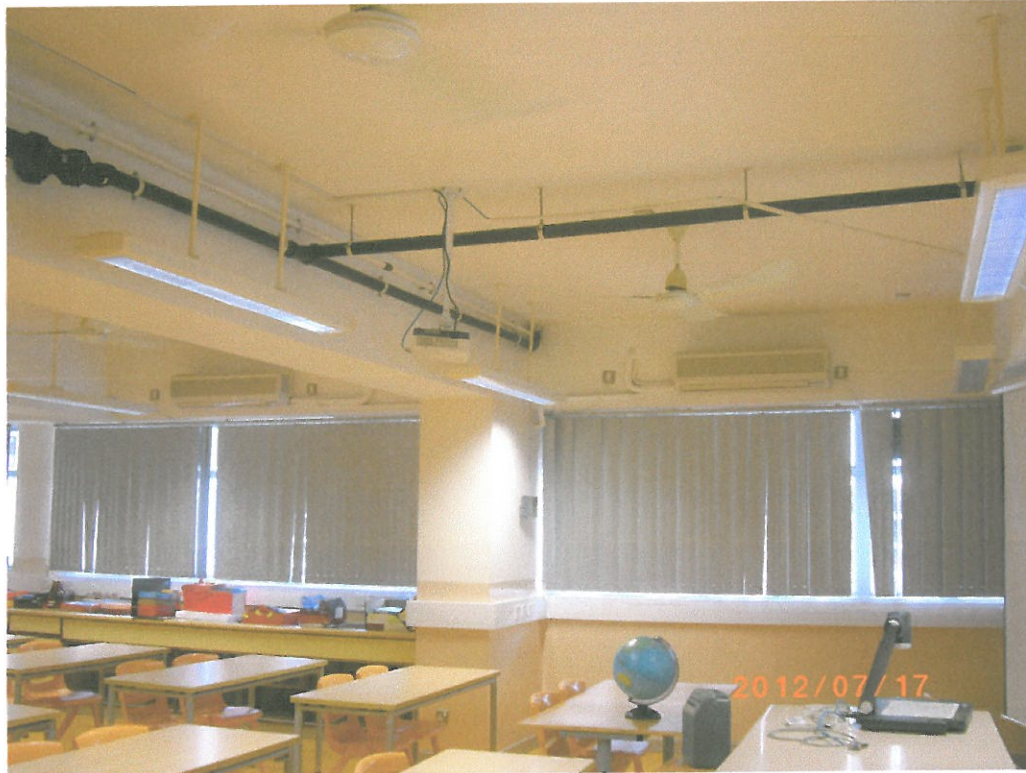
(作參考用途) 課室鋅盆矮櫃 之排水喉做法