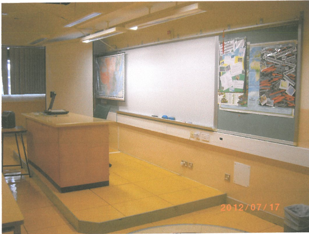
須要施工之舊 翼校舍課室 415 室