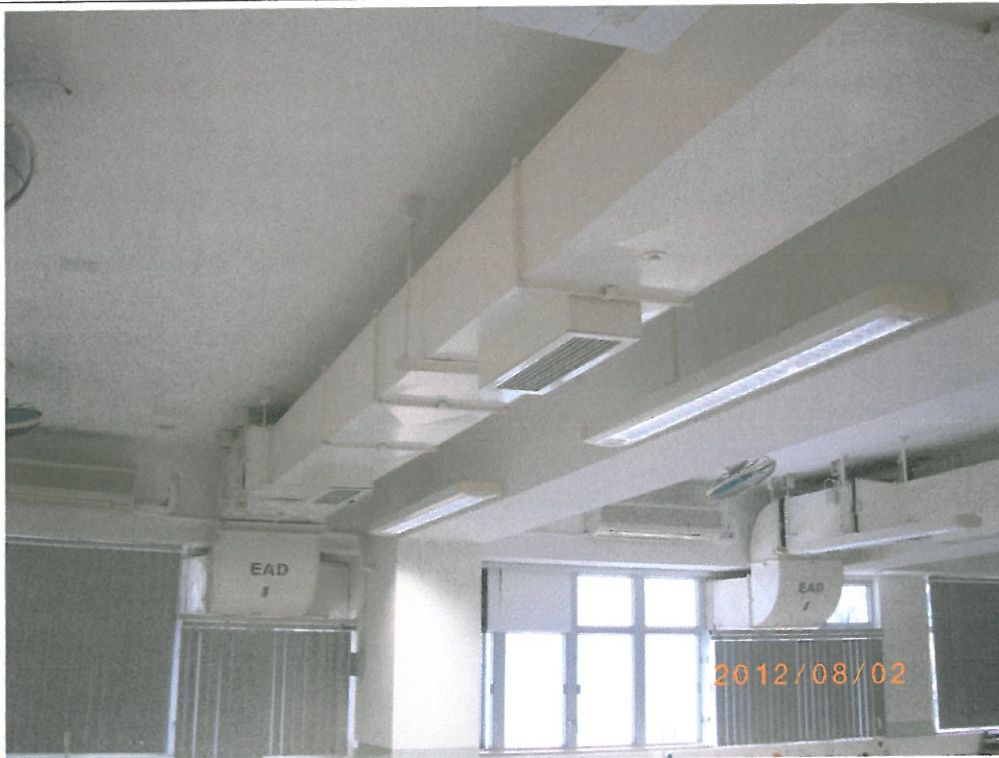
(作參考用途) 舊翼校舍課室 615 課室 - 抽 氣槽